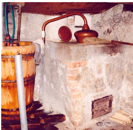
Eine alte Brennerei ohne Wasserbad aus dem Jahr 1928

Das Destillieren einer (Frucht)-Maische zur Abtrennung von Alkohol, bezeichnet man als Brennen und das Produkt häufig als Brand bzw. umgangssprachlich als Schnaps. Zur Zeit Maria Theresias wurde das Brennrecht für „rechtschaffende, fleißige und ordentliche Bauern“ erteilt. 1939 wurde in Österreich das Alkoholmonopol eingeführt, das unter anderem die Herstellung von Alkohol regelt und dabei zwischen Abfindungsbrenner und Verschlussbrenner unterscheidet. Unter Abfindung versteht man die Alkoholherstellung aus selbstgewonnenen alkoholbildenden Stoffen wie Steinobst, Kernobst, Beeren und Wurzeln. Die Herstellung muss mit einem zugelassenen Brenngerät erfolgen. Die steuerpflichtige Alkoholmenge und die mögliche Brenndauer werden durch den Zoll festgelegt. Die Menge und Art der Maische ist für die Berechnung der Alkoholsteuer ausschlaggebend. Der beispielsweise bei Äpfeln und Birnen zur Anwendung kommende Ausbeutesatz von 3% besagt, dass aus 100l Maische 3l Alkohol erzeugt werden können und versteuert werden müssen. Abfindungsbrenner dürfen kein Obst zukaufen. Das Abfindungsbrennrecht gilt für jeden Fruchtbesitzer bzw. Pächter. Das bedeutet, dass jede Person die einen Baum besitzt oder pachtet, berechtigt ist aus den Früchten Alkohol herzustellen. Brände eines Abfindungsbrenners dürfen nur an Endverbraucher und Gastwirte verkauft werden, nicht jedoch an den Handel oder ins Ausland.