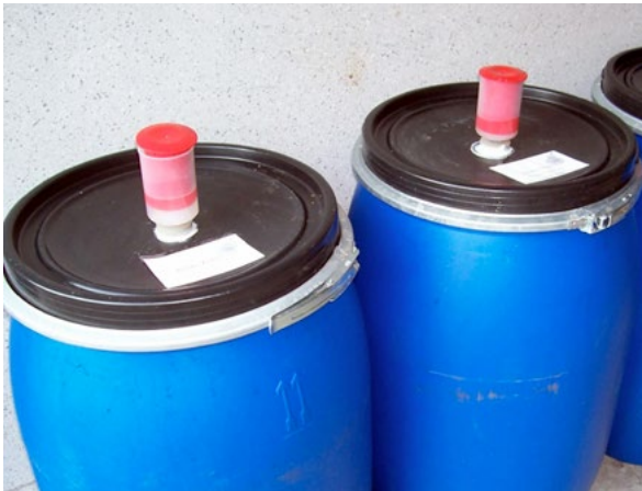
luftdicht verschlossene Gärbehälter mit Gärspund

Die Gärung – bezeichnet den Vorgang, bei dem die Hefe den in der Maische enthaltenen Zucker in Alkohol umwandelt. Das nebenbei entstehende CO 2 muss dabei über den Gärspund entweichen können und gibt Aufschluss über den Fortgang der 1 - 4 wöchigen Gärung.