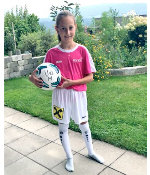
Herzlichen Dank an alle Sponsoren, die diese Anschaffung ermöglicht haben.