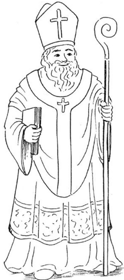
Illustration: Elisabeth Lottermoser, Rheda-Wiedenbrück