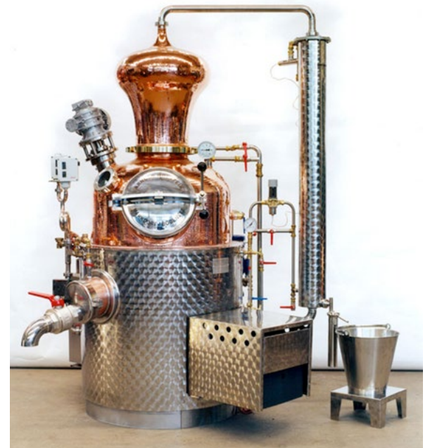
Modernes Brenngerät mit automatischer Heizung, Rührwerk und Edelstahlröhrenkühler

In den 1980er Jahren setzte bei den Schnapsbrennern ein radikales Umdenken ein. Die Qualität wurde zunehmend wichtiger als die Quantität. Man verwendete vermehrt hochwertige Ausgangsprodukte, arbeitete mit einer kontrollierten Gärung des Obstes, destillierte sorgfältiger und auf moderneren Destillieranlagen. Die nächste Generation entdeckte das Destillieren als Hobby und stellte dabei sowohl die Art und Weise als auch die dafür verwendete Technik auf den Kopf.