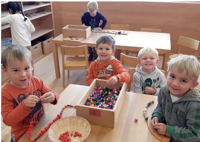
Mit den ersten Bastelarbeiten wurde schon eifrig begonnen