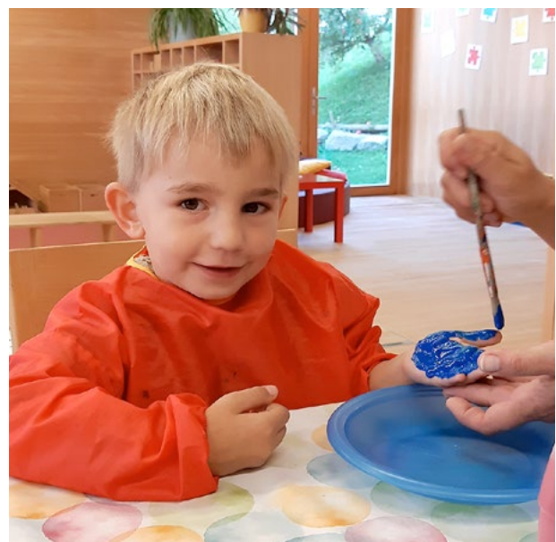
Die Handabdrücke benötigen wir für unsere Turnsäcke