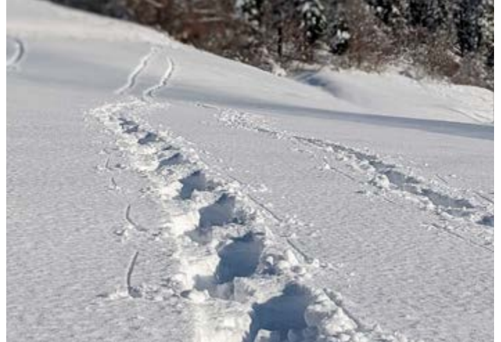
Neue Spuren und Wege zu finden, wird eine der wesentlichen Aufgaben im neuen Jahr und in den darauffolgenden Jahren sein.

Viele Themen, die uns im Privaten beschäftigen, treffen auch oder gerade auf die Gemeinde zu. Herausforderungen und Wünsche gibt es an allen Ecken und Enden. Das Geld wird nicht mehr – im Gegenteil, alle Gemeinden kämpfen mit Mindereinnahmen und einem Anstieg der Ausgaben. Wir werden sehen was das kommende Jahr an Herausforderungen mit sich bringen wird. Wir werden sie auf jeden Fall annehmen und uns mit ihnen ernst- und gewissenhaft auseinandersetzen. Veränderungen sind nichts Schlechtes