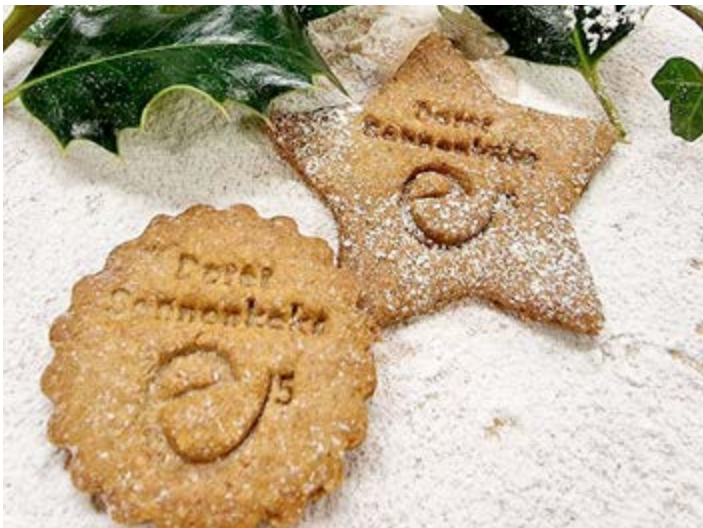
Mit dem "Dorener Sonnenkeks" brachte das e-5-Team süße und sonnige Gedanken in die Herzen vieler BürgerInnen.

All das klingt möglicherweise zu einfach und zu positiv – auch ich fürchte mich dann und wann davor, dass sich manches nicht mehr zum „Guten“ ändert. Dennoch gilt es meiner Meinung nach, einige „Sonniger-Leben-Faktoren“ zu beherzigen – „Lache und die Welt lacht mit dir – genieße dein Leben – bleib cool – habe Respekt vor Älteren – das Leben ist zu kurz für irgendwann – sei dankbar – setze dich ein für Andere“.