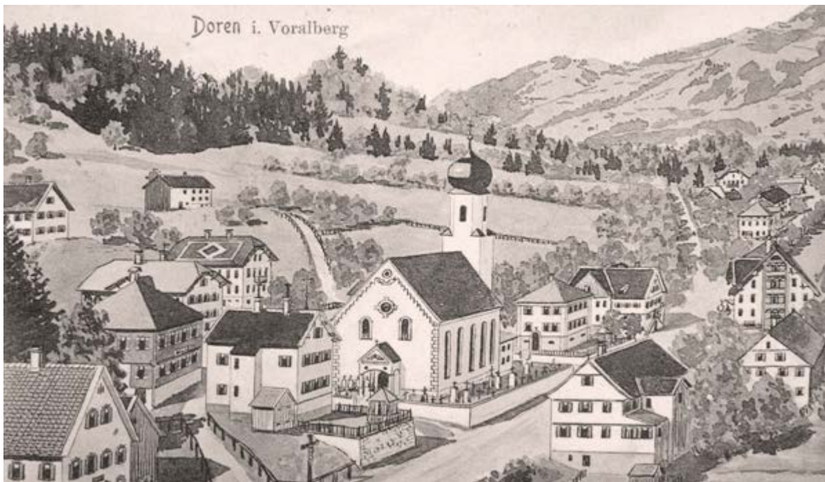
Doren um 1900.

den eigene Gesetze erlassen und in einem sogenannten Landsbrauch, einem lokalen Gesetzbuch, festgehalten. Weiteren Einfluss gewann Sulzberg, nachdem es im Jahr 1711 vom Oberamt Bregenz den Gerichtsstab verliehen bekam. Während der Napoleonischen Kriege wurde die Gemeinde unter Bayrischer Besetzung in zwei Teile getrennt. Die Trennlinie verlief von der Bregenzerach aufsteigend genau über den Bergrücken.