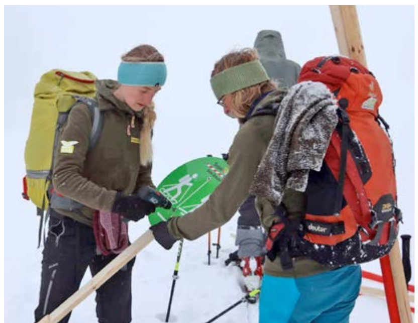
Austausch der Sommer-Übersichtstafeln gegen die Winterbeschilderung.